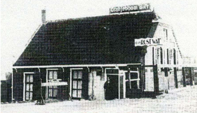
Oude cafe Rustwat.